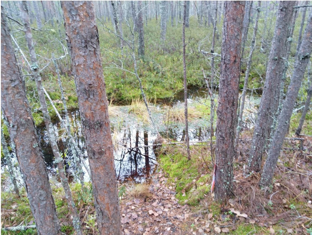
Kuva 1. Suunnittelualueen itäpuolisella rämeellä oleva kaivantolammikko on jokseenkin viitasammakolle soveltuvaa elinympäristöä.

Lepakoiden ohella Kuivasojan kohdalla tarkasteltavaksi tulevat kyseeseen lähinnä saukko. Oulussa saukkoa on tavattu ainakin Oulujoen alueella ja Kalimenojalla. Saukon kohdalla Kuivasoja voisi toimia lähinnä satunnaisena kulkureitinä. Suunnittelualueelle tai sen läheisille osille Kuivasojaa ei sijoitu koskimaisia tai talvisin sulana säilyviä jaksoja, jotka voisivat toimia tärkeämpinä ravinnonhankintakohteina.